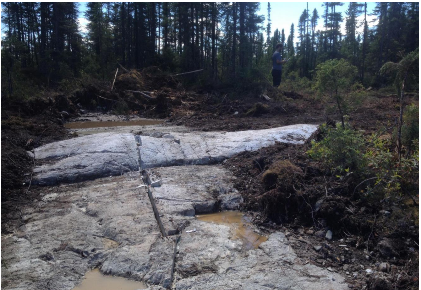
Découpage à la pelle mécanique et échantillonnage sur des claims miniers