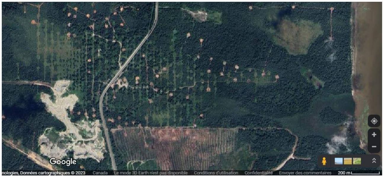
Coupes forestières et trous de forages sur les claims miniers du projet d'or Marban de la mine O3, dans les bassins versants du Lac De Montigny et de la rivière Harricana