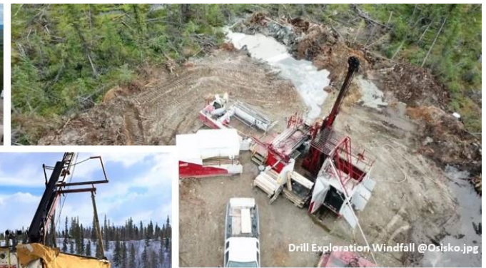
Drill Exploration Windfall @Ostako.jpg