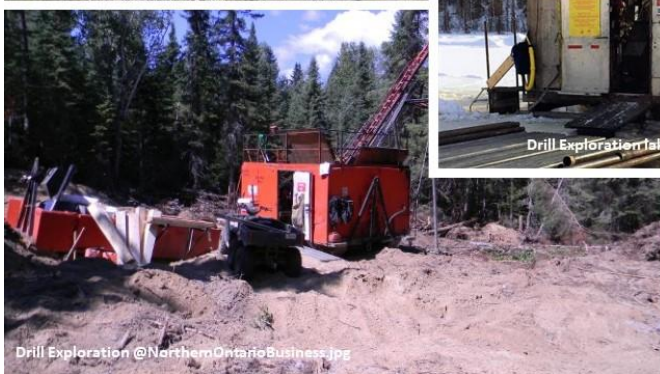
Drill Exploration @NorthernOntarioBusiness.jpg