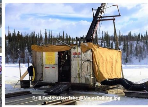
Drill Exploration Lake @MajorDrilling.jpg